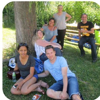
Moment de détente et de bien être!