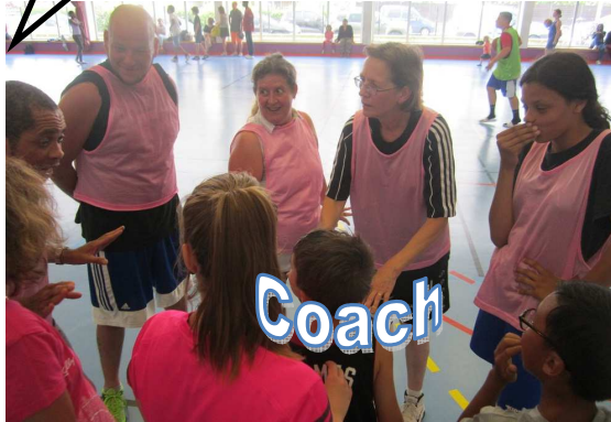
Les poussins coachés par une fleur rose.