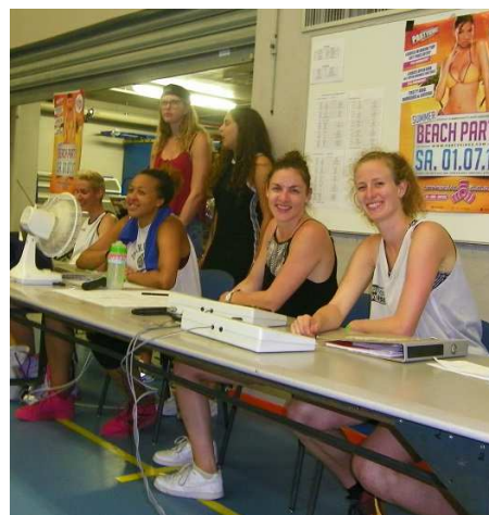
La table VIP