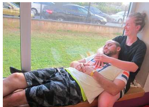
Première participation de l'équipe de Valentigny