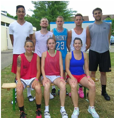
Les vainqueurs des trois points.