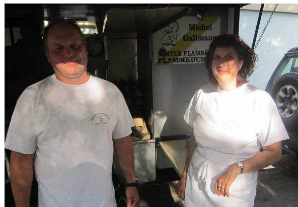
Le service tartes flambées Gallmann à l 'œuvre pour satisfaire les Libellules.