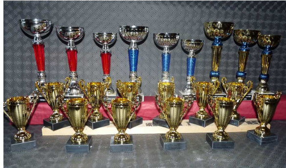
Les vainqueurs des dunks.